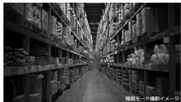
暗視モードの映像はモノクロになります。