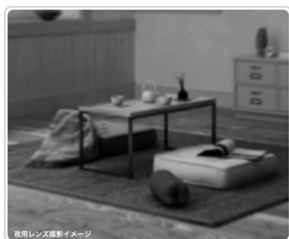
夜用レンズ撮影イメージ