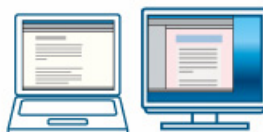
インターネットで調べものしながら の文書作成にも!